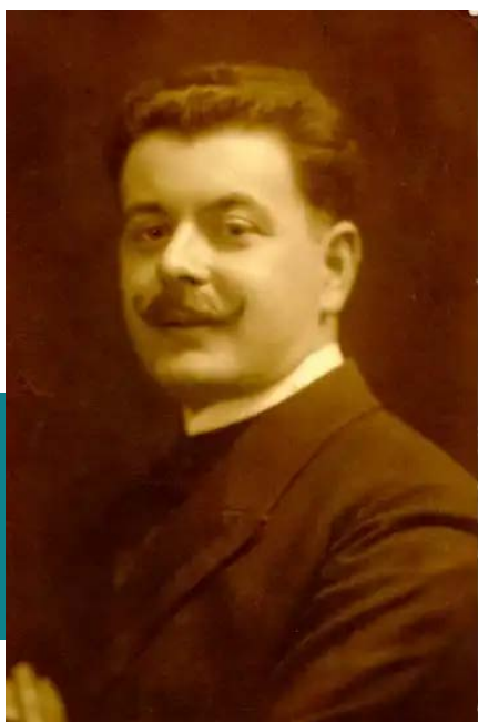
Wallenstein Zoltán Magyar Zsidó Múzeum és Levéltár

lésen (kongresszuson) bekövetkezett egyházszakadás óta felekezetpolitikai tekintetben status quo ante platformon állt. 3 Vagyis nem csatlakozott sem az 1869-ben megalakult kongresszusi/neológ, sem az 1871-ben létrejövő ortodox hitközségi szervezethez. A pécsiek a Magyarországon működő hitközségek kicsiny hányadához hasonlóan az 1868/69-es kongresszust megelőző állapothoz – azaz a status quo ante helyzethez – ragaszkodtak. A status quo ante alapon álló hitközségek évtizedeken keresztül nem törekedtek arra, hogy saját egyházszervezetet hozzanak létre, vagy bármelyik létező egyházszervezethez csatlakozzanak; 1927-ben viszont úgy döntöttek, hogy megalapítják a „Status quo ante izraelita hitközségek Országos Szövetségét”. Ellentmondásosnak tűnhetett ugyanakkor, hogy miközben a Pécsi Izraelita Hitközség évtizedeken keresztül feltehetően az önállóság és függetlenség megőrzése jegyében status quo ante alapon állt, a vallásgyakorlat tekintetében egyértelműen a neológ felfogást képviselte (ezt tükrözte az ún. doktor-rabbik preferálása, valamint a liturgia terén az orgona és a kórus alkalmazása).