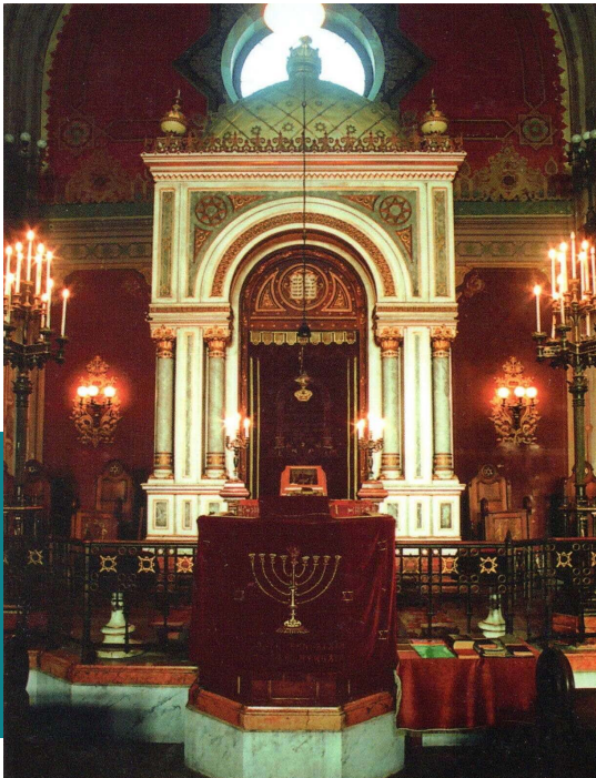
Pécs, a zsinagóga belső tere